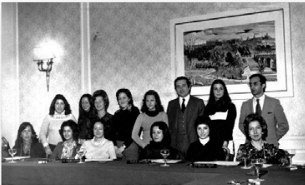
1973 - Curso Secretarias Hotel Fénix