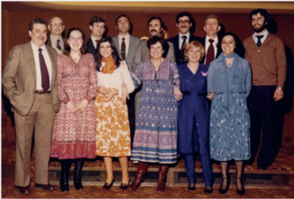
1997 - Premio de Inspección OP