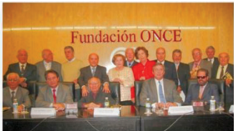
Arriba, los premiados del V Concurso Literario de UDP

El certamen es un homenaje de los mayores en el IV Centenario de la publicación del Quijote, y todos los trabajos presentados tratan sobre la figura del hidalgo manchego. Además de los premios en metálico, los relatos ganadores han sido publicados en un libro editado por la Unión Democrática de Pensionistas (UDP), organizadora del Concurso.